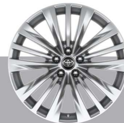
Naplatci od lake legure 20" (5 trostrukih krakova) Standardno na Executive