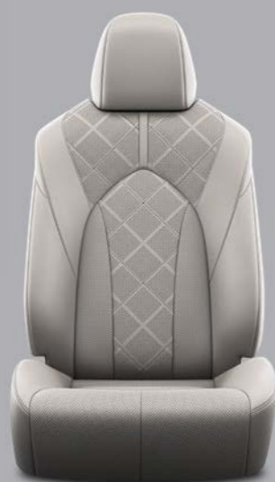
Crna koža s prošivenim uzorkom i crnim šavovima Standardno na Executive