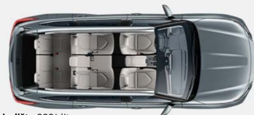
7 sjedišta 332* litre

Prostranost na zahtjev Štagod trebali, gdje god išli, Highlander nudi niz konfiguracija sjedenja.