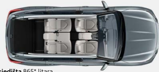
5 sjedišta 865* litara