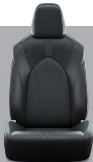
Crne presvlake od umjetne kože s crnim šavovima Standardno na Elegant