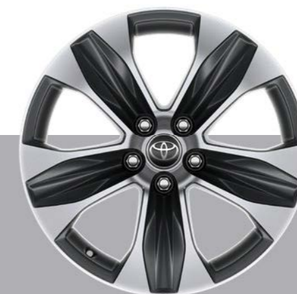
Tamno sivi alu naplatci, 18", mašinski obrađeni (5 krakova) Standardno na Elegant