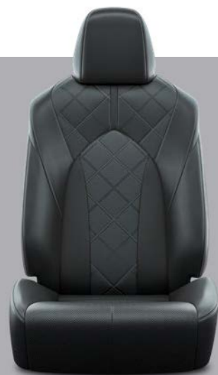
Crna perforirana koža s četvrtastim uzorkom i crnim šavovima Standardno na Premium