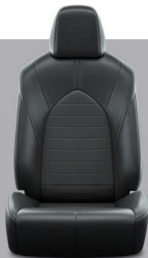
Grafitna koža s prošivenim uzorkom i crnim šavovima Standardno na Executive