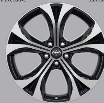
Alu naplatci, 20", mašinski obrađeni (5 krakova) Opcija za sve nivoe opreme