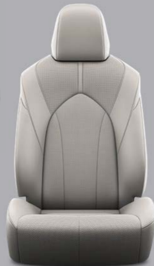
Grafitna perforirana koža s četvrtastim uzorkom i crnim šavovima Standardno na Premium