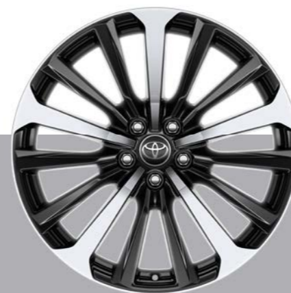
Alu naplatci, 20", mašinski obrađeni (10 krakova) Standardno na Premium