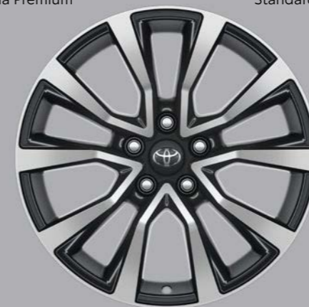
Alu naplatci, 18", mašinski obrađeni (10 krakova) Opcija za sve nivoe opreme