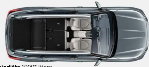
2 sjedišta 1909* litara