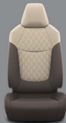
Tarnosmeđa tkanina s bež podstavljenim umetcima Standardno za opremu Luna i Sol