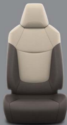
Tarnosmeđa tkanina s bež umetcima Standardno za opremu Terra