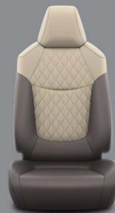
Tarnosmeđe, djelomično kožne presvlake s bež šavovima Standardno za opremu Executive