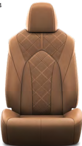
4. Oker perforirana koža s četvrtastim uzorkom i crnim šavovima Standardno na Premium