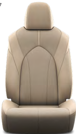
7. Bež koža s prošivenim uzorkom i crnim šavovima Standardno na Executive