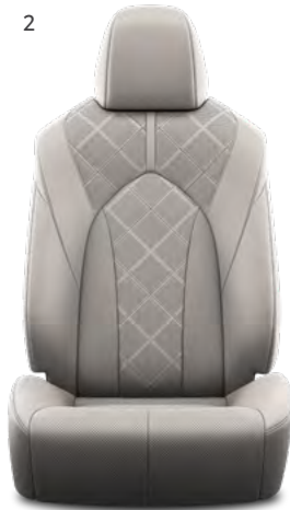
2. Grafitna perforirana koža s četvrtastim uzorkom i crnim šavovima Standardno na Premium