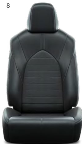
8. Crna koža s prošivenim uzorkom i crnim šavovima Standardno na Executive