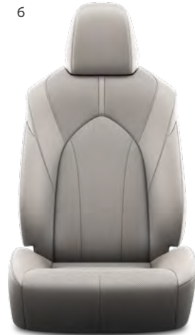
6. Grafitna koža s prošivenim uzorkom i crnim šavovima Standardno na Executive