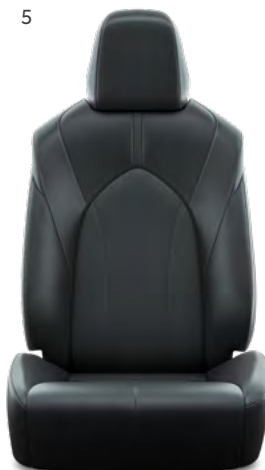
5. Crne presvlake od umjetne kože s crnim šavovima Standardno na Elegant