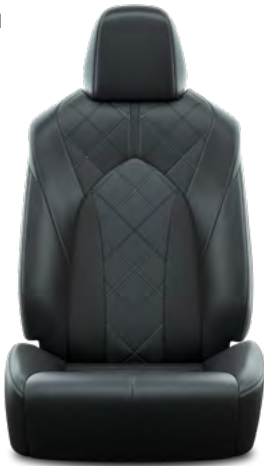
1. Crna perforirana koža s četvrtastim uzorkom i crnim šavovima Standardno na Premium