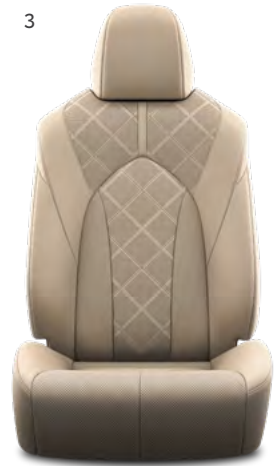
3. Bež perforirana koža s četvrtastim uzorkom i crnim šavovima Standardno na Premium