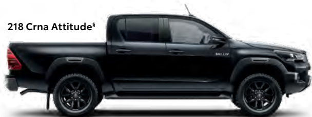
218 Crna Attitude §