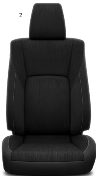
2. Crna tkanina s vertikalnim uzorkom Standardno na City i City Plus