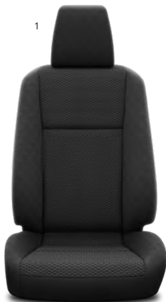
1. Crna tkanina s oblim uzorkom Standardno na Country i Comfort