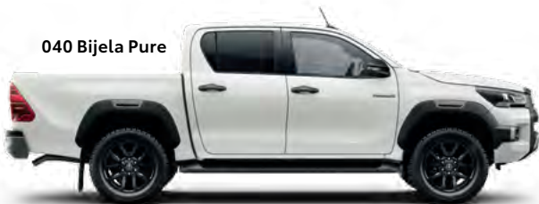
040 Bijela Pure