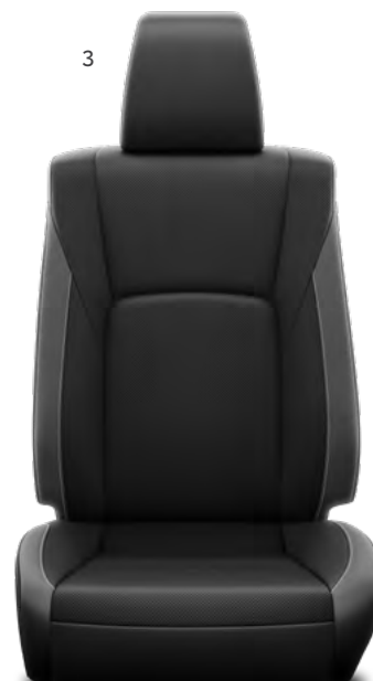
3. Dvobojna perforirana koža Standardno na Invincible