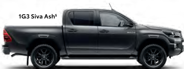
1G3 Siva Ash §