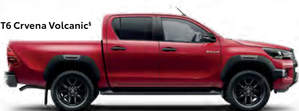
3T6 Crvena Volcanic §