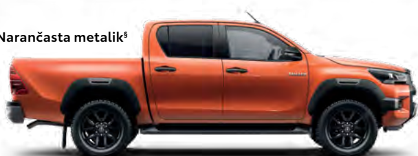
4R8 Narančasta metalik §