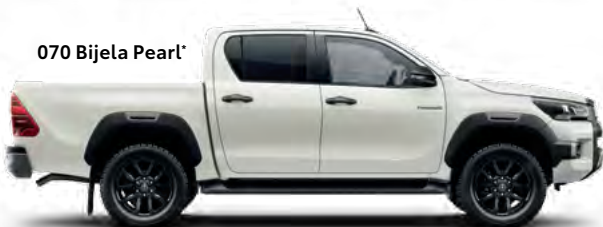
070 Bijela Pearl *