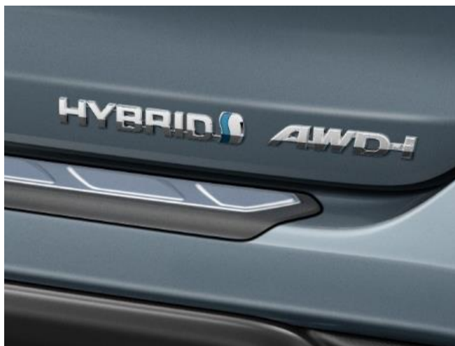
1. AWD-i – Amblem