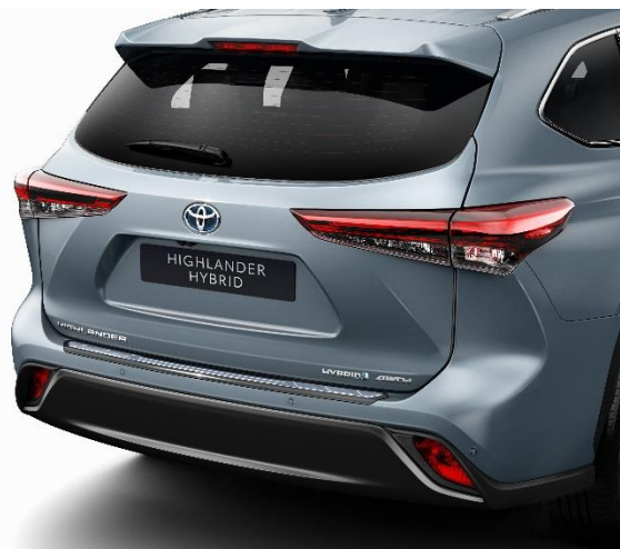
2. Zaštitna lajsna zadnjeg branika - nerđajući čelik