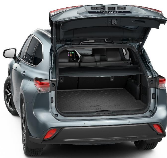
4. Gumena zaštita prtljažnika