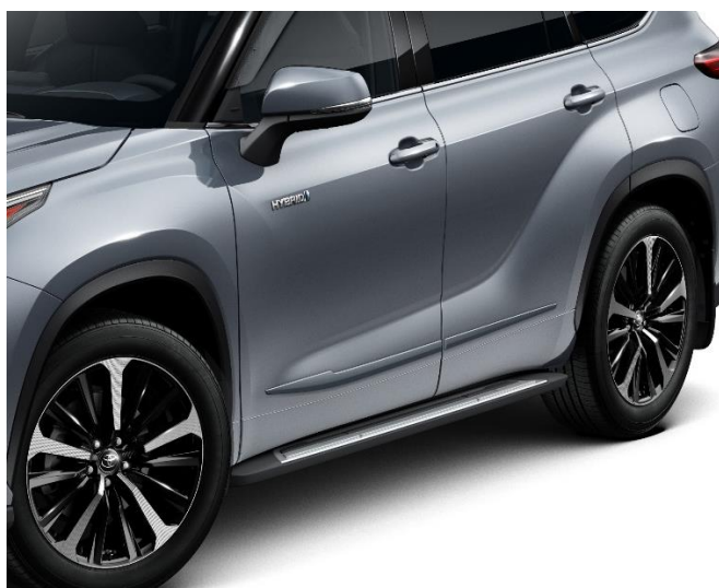
3. Bočna zaštitna lajsna u boji vozila