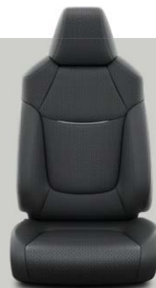
Crna koža sa sivim ivicama i šavovima Opciono uz Limited i Elegant opremu.