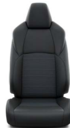
Crna imitacija kože sa plavim šavovima Standardno uz Style opremu