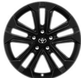
18-inčni crno obojeni aluminijumski naplaci (5 duplih krakova) Standardno uz Elegant i opciono uz sve opreme