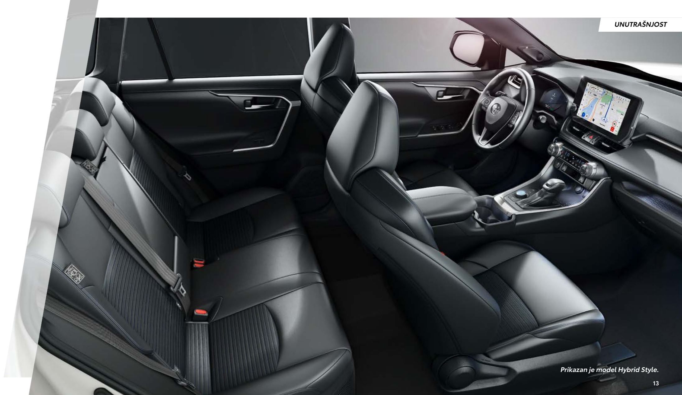
Prikazan je model Hybrid Style.

Prikazan je model Hybrid Style sa opcionim panoramskim krovom.