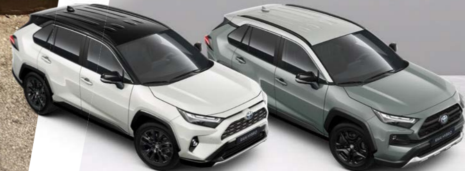
RAV4 bi-tone karoserija