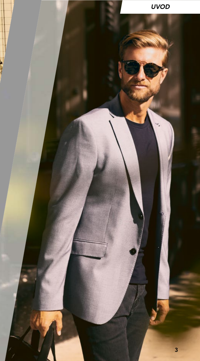
Prikazan je model Style Hibrid.