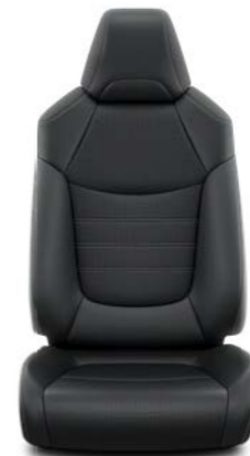
Crna koža Standardno uz Premium opremu