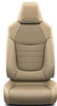
Bež koža Standardno uz Premium opremu