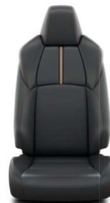
Crna koža sa narandžastim detaljima i šavovima Standardno uz Adventure