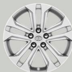
18-inčni srebrni aluminijumski naplaci (5 duplih krakova) Opciono uz sve opreme