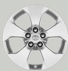
17-inčni srebrni aluminijumski naplaci (5-kraki) Opciono uz sve opreme