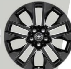
19-inčni crno obojeni aluminijumski naplaci (5 duplih krakova) Opciono uz Style i Premium opremu