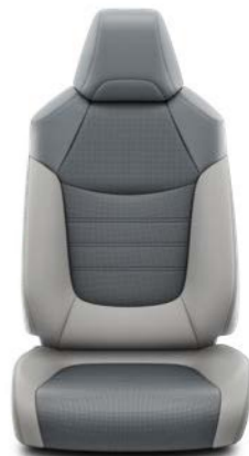
Svetlo siva koža Standardno uz Premium opremu