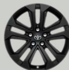
18-inčni crno obojeni aluminijumski naplaci (5 duplih krakova) Opciono uz sve opreme