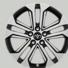
18-inčni mašinski obrađeni aluminijumski naplaci (5 duplih krakova) Opciono uz sve opreme