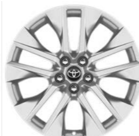
19-inčni srebrni aluminijumski naplaci (5 duplih krakova) Standardno uz Premium opremu