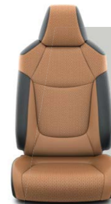
Svetlo braon i crna koža* Opciono uz Limited i Elegant opremu.