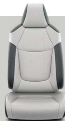
Siva i crna koža* Opciono uz Limited i Elegant opremu.