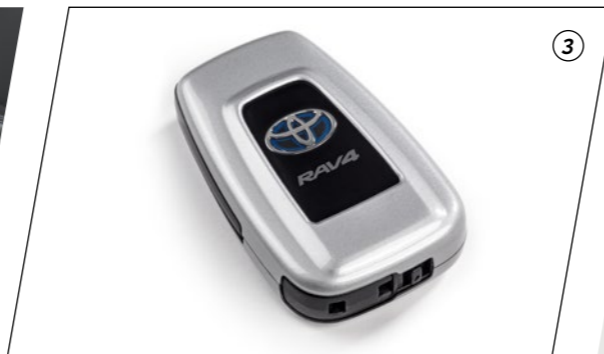
Premium poklopac smart ključa