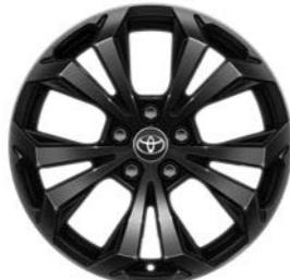
18-inčni crno obojeni aluminijumski naplaci (5 duplih krakova) Standardno uz Style