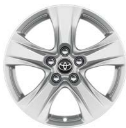
17-inčni srebrni aluminijumski naplaci (5-kraki) Standardno uz Comfort i Limited opremu