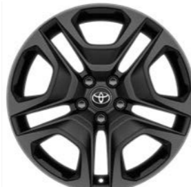
19-inčni crno obojeni aluminijumski naplaci (5 duplih krakova) Standardno uz Adventure