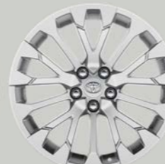
19-inčni srebrni aluminijumski naplaci (15-kraki) Opciono uz Style i Premium opremu