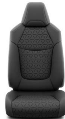
Crni tekstil Standardno uz Limited i Elegant opremu