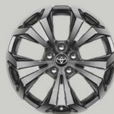
18-inčni srebrni aluminijumski naplaci (5-kraki) Opciono uz Elegant