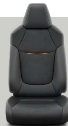
Crna Alcantara* i koža sa svetlo braon ivicama i šavovima* Opciono uz Limited i Elegant opremu.