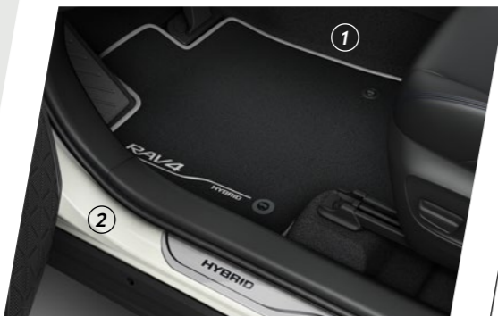
Aluminijumske lajsne na pragovima i tekstilne patosnice

Premium poklopac smart ključa (3) daje krajnji pečat izgledu vašeg hibrida.