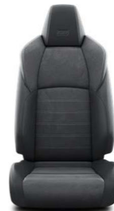
GR SPORT kombinacija kože i "jelenske kože" sa srebrnim šavovima Standardno za opremu GR SPORT