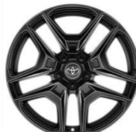
19-inčni sjajno crni aluminijumski naplaci sa konturisanim ivicama (5 duplih krakova) Standardno za opremu GR SPORT