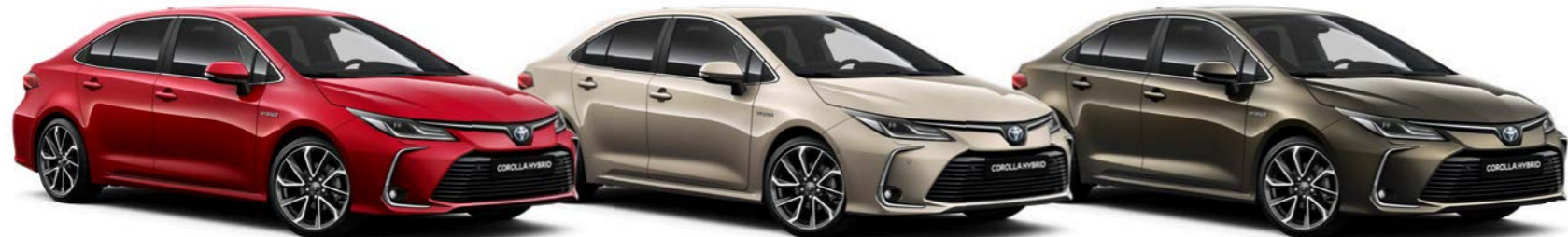
3U5 Vatreno crvena / Flame Red §