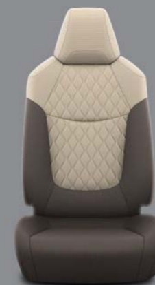
Tamno braon tkanina sa bež prošivenim umećima Standardno uz Luna i Sol opremu