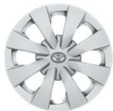
15-inčni čelični naplaci sa poklopcima (8 krakova) Standardno uz Terra opremu