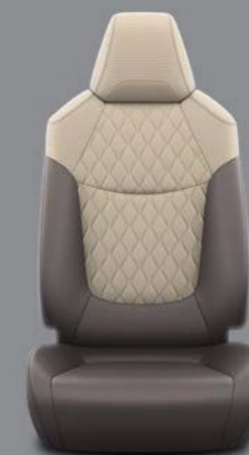
Tamno braon delimična koža sa bež šavom Standardno uz Executive opremu