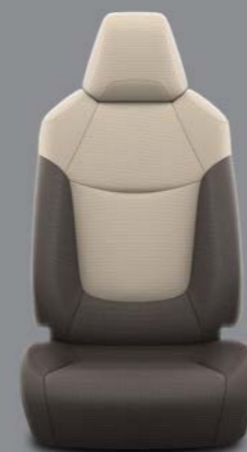
Tamno braon tkamina sa bež dodacima Standardno uz Terra opremu