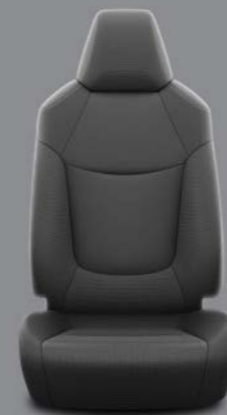
Crna tkanina Standardno uz Terra opremu