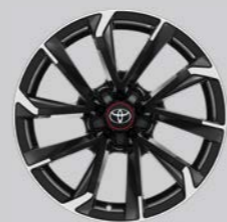
18-inčni bi-tone crni mašinski obrađeni aluminijumski naplaci (5 krakova) § Opciono uz opremu GR SPORT