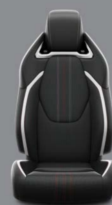
Siva tkanina sa crnim podupiračima nalikom na kožu i satenskim ukrasima Standardno uz opremu GR SPORT