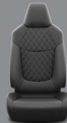
Crna delimična koža sa bež šavom Standardno uz Executive opremu