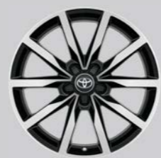
18" crni naplaci od legure (5 dvostrukih krakova) Opciono uz sve opreme