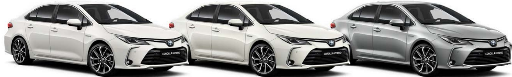
040 Čisto bela / Pure White