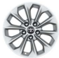
16-inčni aluminijumski naplaci (10 krakova) Standardno uz Luna opremu