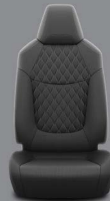
Crna tkanina sa prošivenim umećima Standardno uz Luna i Sol opremu