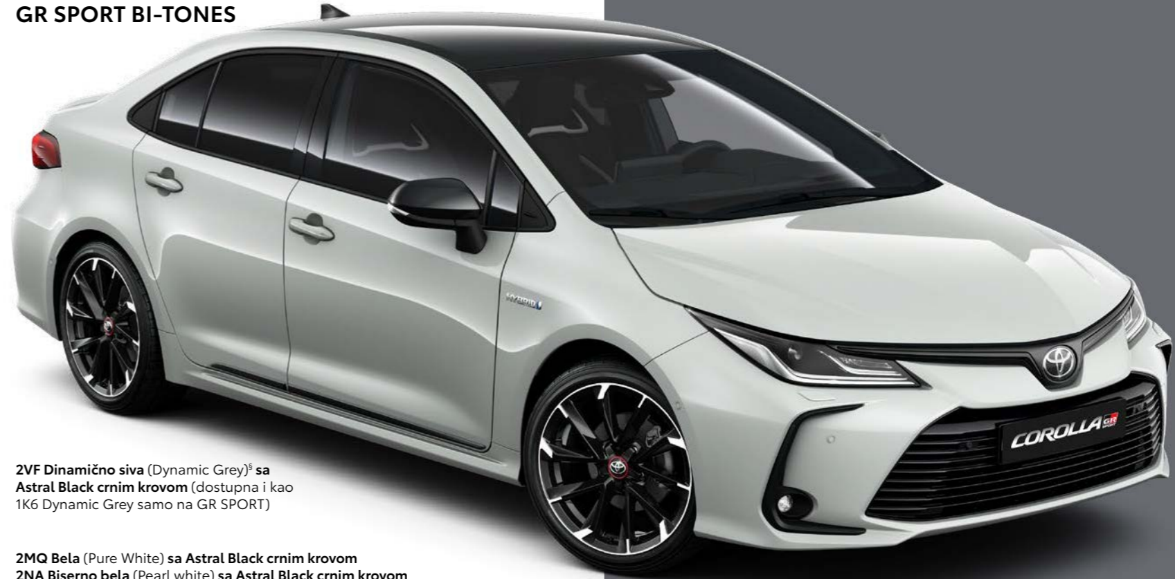
2VF Dinamično siva (Dynamic Grey) § sa Astral Black crnim krovom (dostupna i kao 1K6 Dynamic Grey samo na GR SPORT)